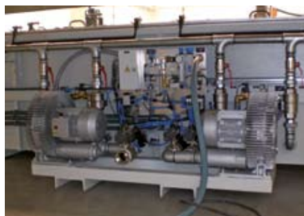
Vorblasluft und Vakuumverteilung