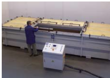
MaxiForm Vorblaskasten, Heizung kundenseitig